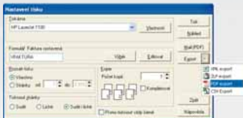
Rychlý export libovolné tiskové sestavy ve zvoleném